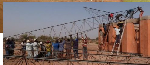
Aufsetzen der Dachkonstruktion