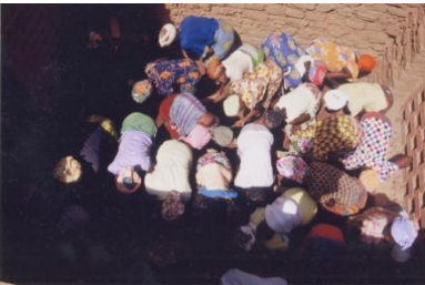
Die Kinder tragen Steine zum Bau; die Männer aus dem Dorf mauern; die Frauen stampfen auf traditionelle Weise den Boden.