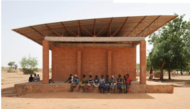
Unten: das erste Schulgebäude

Um den großen Zulauf zu bewältigen, ist 2009 ein zweites Schulhaus entstanden.