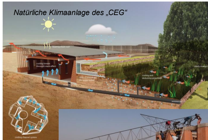
Natürliche Klimaanlage des „CEG“

Die Erfolge der Schule sind so groß, dass die Regierung auf sie aufmerksam wurde und beschlossen hat, das Geld für die Bezahlung von Lehrern einer weiterführenden Schule (CEG) bereitzustellen. Auch dieser Bau, der 2012 begonnen wurde, hat Vorbildcharakter für ganz Afrika: die Bevölkerung packt mit an beim Bau; es wird weitgehend mit lokalen Materialien gebaut und die klimatischen Gegebenheiten des Landes werden nicht nur berücksichtigt, sondern ausgenutzt und eine „natürliche Klimaanlage“ geschaffen. 2013 werden die ersten Schüler in der neuen Schule einziehen.