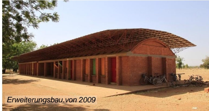
Erweiterungsbau von 2009

Um den großen Zulauf zu bewältigen, ist 2009 ein zweites Schulhaus entstanden.