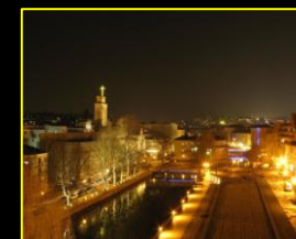
Pforzheim bei Nacht