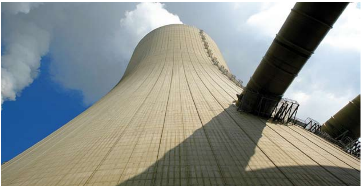
Bild 1: Außenansicht des BoA-Kühlturms und der Rauchgaskanäle in Niederaußem

In der Nachbarschaft zum Kraftwerksstandort Niederaußem hat RWE Power eine Anlage zur Einbindung von CO 2 aus dem Kraftwerk in Mikroalgen errichtet.