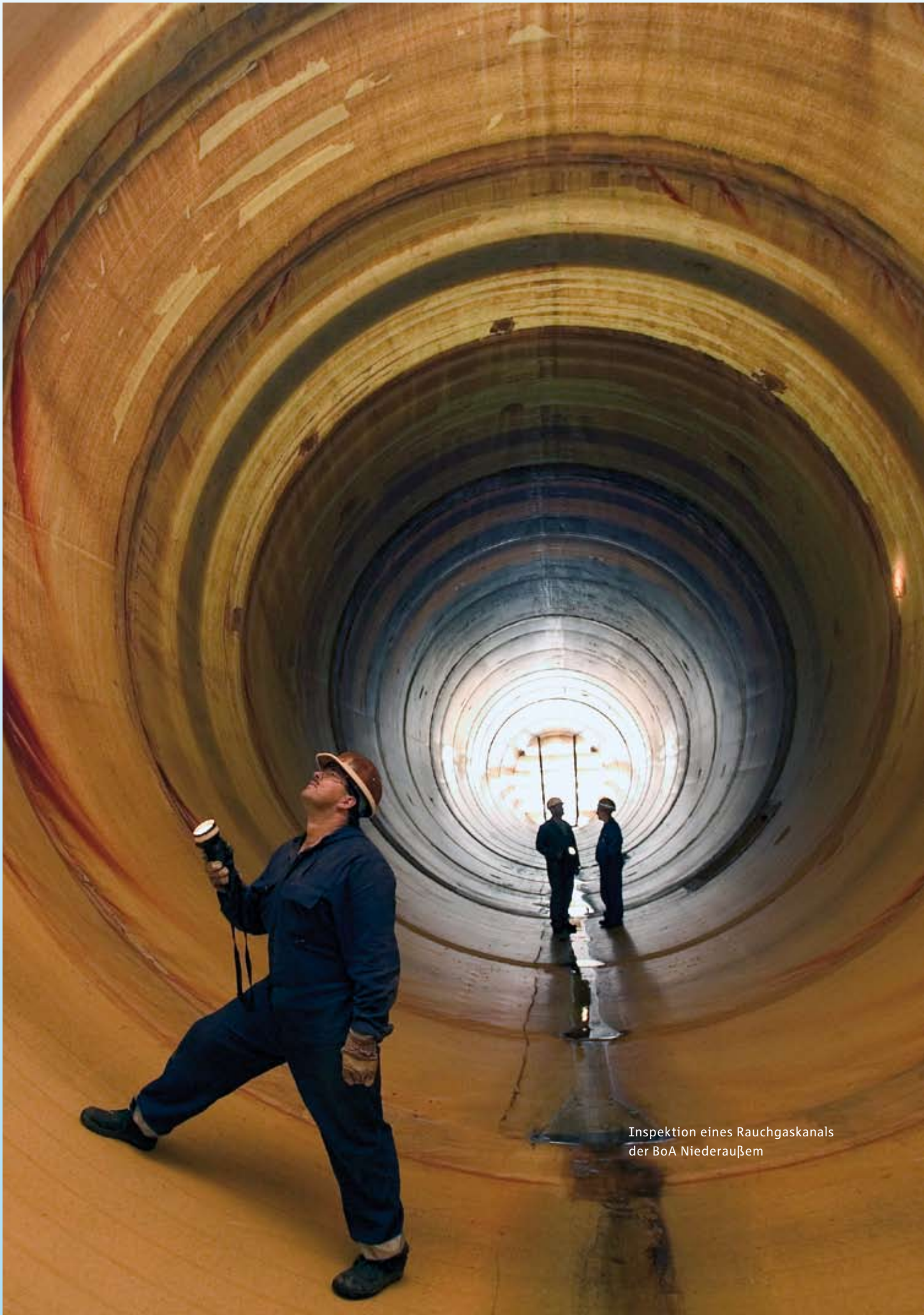
Inspektion eines Rauchgaskanals der BoA Niederaußem